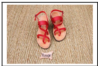
Crétoise 65 €